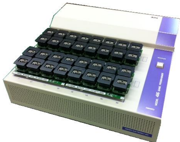
MODEL416 SUEMMC-400 4個装着時