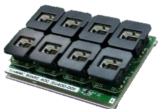
1ユニットでソケット8個搭載